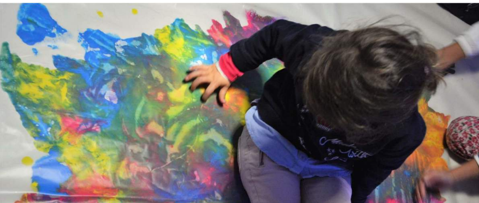
Tableau blanc de Meudon- Peinture Propre - Table dessin sur sable Ombres et dessins en rétroprojection