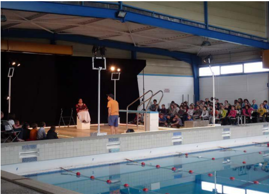
une représentation au bord de la piscine d'Hazebrouck