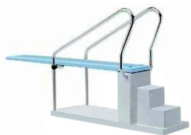
Plongoir à roulettes de Marc Lainé

Le dispositif léger et ludique conçu avec le scénographe Marc Lainé permet de faire voyager cette pièce dans des lieux insolites ou inappropriés.